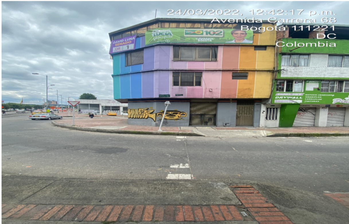
Imagen panorámica del inmueble de referencia.